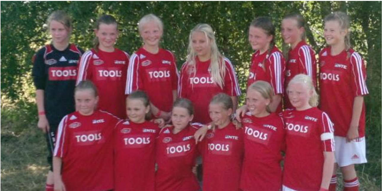
Jenter 12 år på Storsjøcup

Våre lag har representert Stiklestad på mange cuper i distriktet, og jenter og gutter 12 år har også deltatt på Storsjø-cup i Østersund.