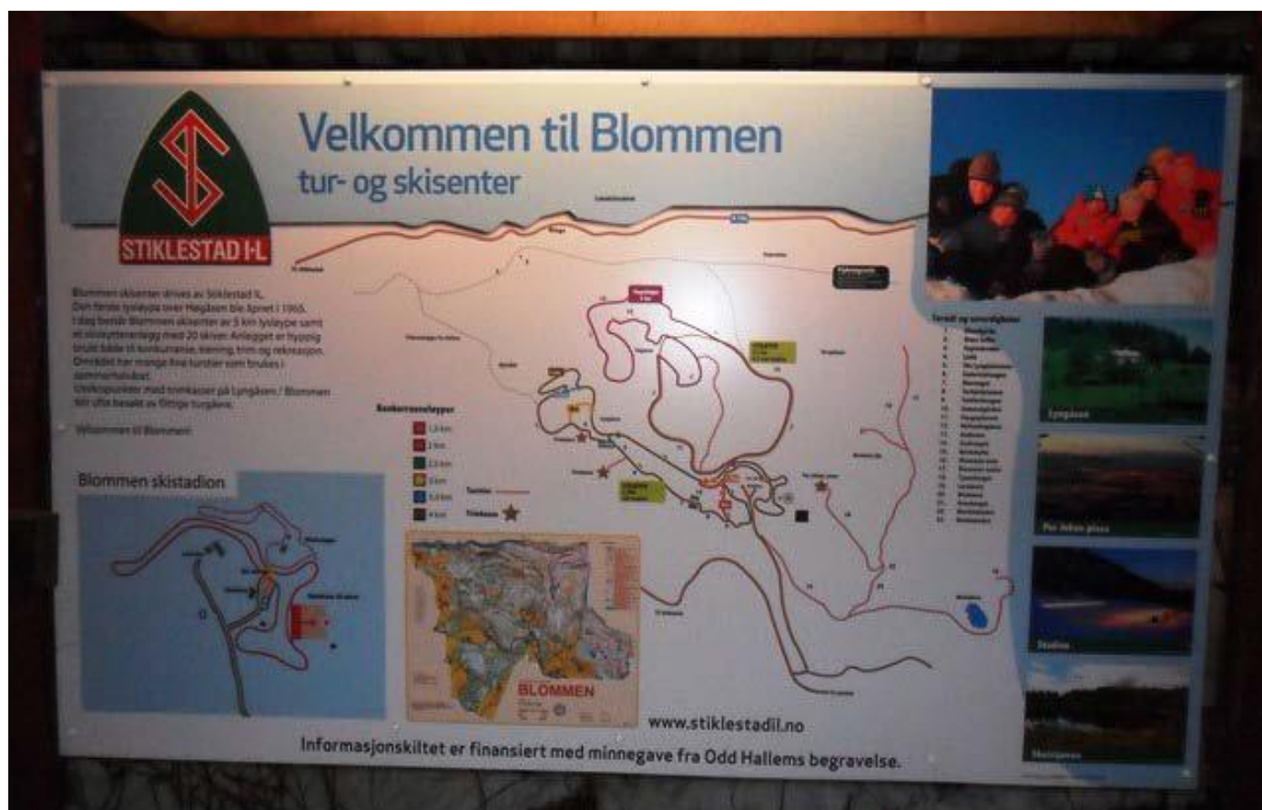
Nytt skilt i Blommen