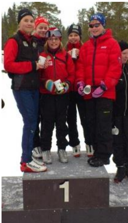
Stiklestad jenter under avslutningen i Sokna